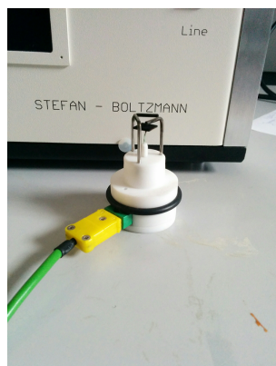
4. ábra. A hősugárzás mérésére szolgáló termoelem vagy szonda. A kormozott felület hatékonyabbá teszi az elnyelést, amit egy kis keret védi nehogy lekopjon róla.