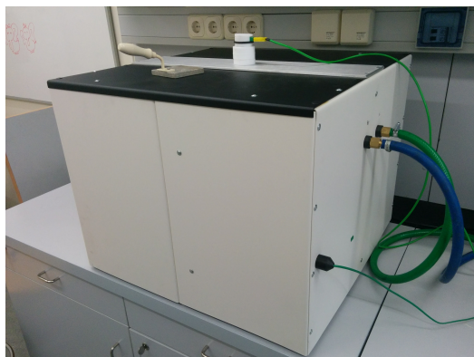
3. ábra. Az edényt tartalmazó doboz.